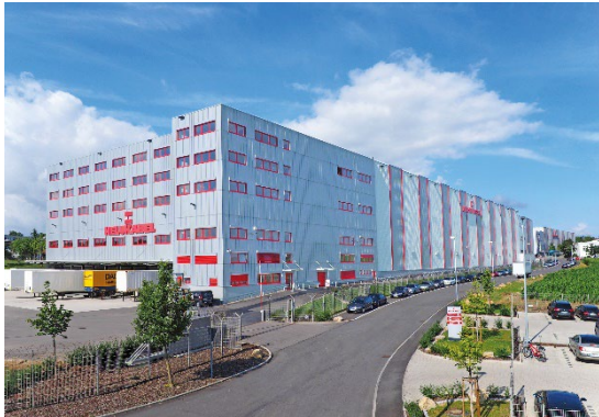
Bild 1: Die HELUKABEL Gruppe mit Stammsitz im baden-württembergischen Hemmingen ist ein international führender Hersteller und Anbieter von Kabeln, Leitungen und Kabelzubehör.